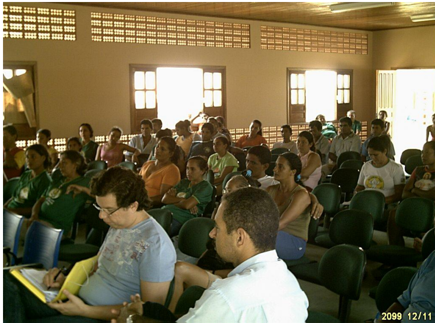
Figura 05. Momento de estudo em Sala de Aula

O 8º Tempo Escola do Projeto Saúde em Movimento na Transamazônica aconteceu no Instituto Federal do Pará/IFPA antigo CEFET em Altamira no período de 17 a 29 de junho de 2010, sob o Eixo Temático: Saúde e Trabalho no Campo e foram ofertadas as seguintes disciplinas: