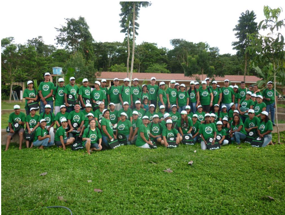
Figura 11. Encerramento do Curso de Formação Integrada em Técnico Agente Comunitário de Saúde Ensino Médio – Educação Profissional.

Considera-se que o potencial crítico e criativo dos/as educandos/as, aliado a qualificação e experiência do coletivo docente e ao engajamento da Equipe do Projeto/Curso (Coordenação, Técnicas e Universitários/Bolsistas), parceiros tem possibilitado a construção coletiva, pertinência dos instrumentos e qualificação do processo de acompanhamento e avaliação nas ações educativas em sala de aula e nos assentamentos.