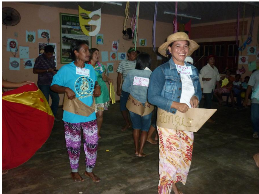
Figura 09. Apresentação Cultural de Dança

Este último Tempo Escola do Curso aconteceu de maneira inter e multidisciplinar, onde todas as disciplinas ministradas foram juntas em espaço e tempo. Para tanto, foram construídos 10 temas sobre o cotidiano dos Agentes Comunitários de Saúde/ACS do qual serão construídos uma Palestra Profissional a ser apresentadas no Seminário Final do último dia do período, realizaram – se ainda, aulas práticas de Estágio, Filosofia, sociologia, Informática e Língua Portuguesa voltada para a realidade dos ACS. Ao mesmo tempo em que os educandos se envolvem sociológica e filosoficamente com alguma questão, estarão também pesquisando na internet e, amparados na gramática, construir textos e slides, produzindo palestras para as comunidades atendidas e que são atividades próprias do “quefazer” dos ACS.