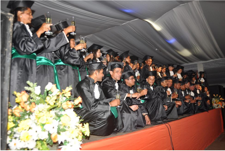
Figura 14. Formatura da Turma Técnico Agente Comunitário de Saúde. Fonte: Arquivo Pessoal, 2011