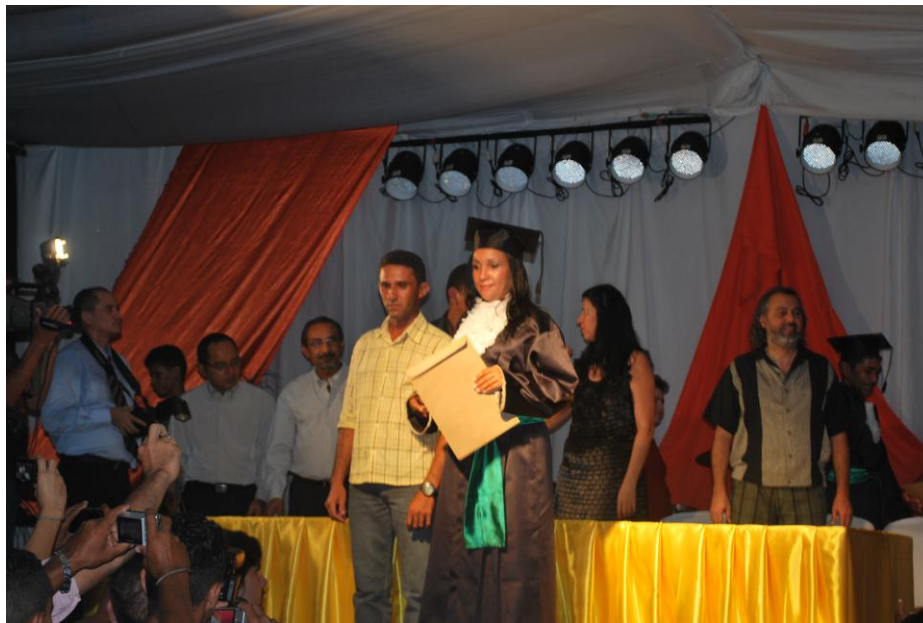
Figura 13. Entrega de certificado de conclusão curso.