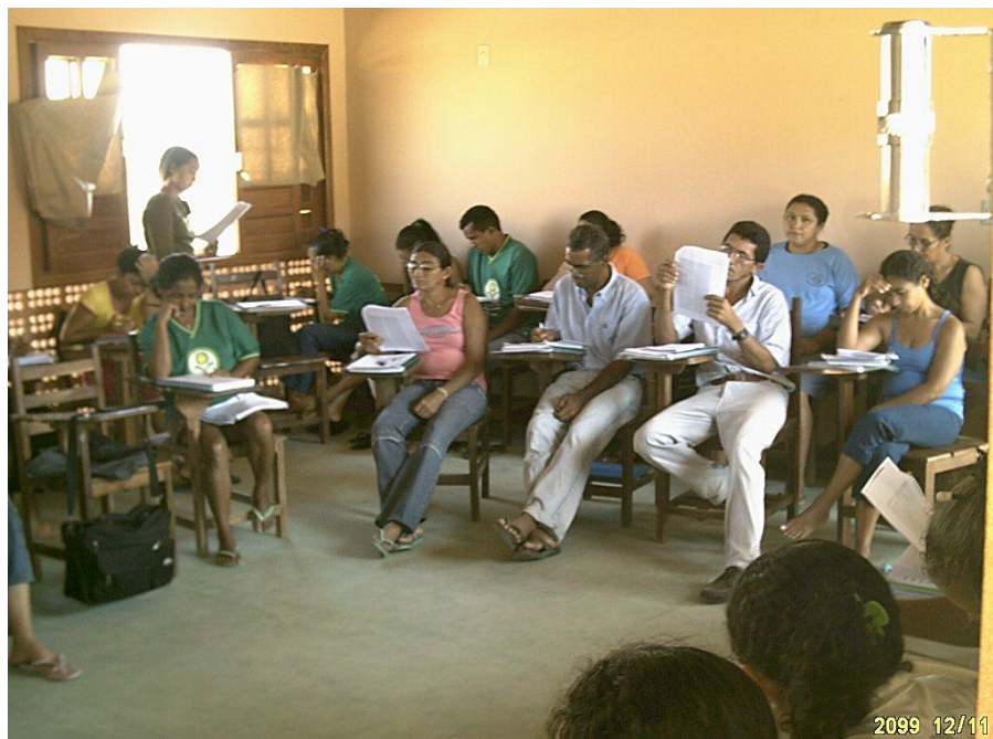
Figura 07. Leitura e Concentração nos estudos em sala de aula

Apresentação dos trabalhos das equipes teve como público a comunidade rural que foi convidada, representantes da CFR e os professores que ministraram aula, os trabalhos foram bastante divertidos e educativos devido às mensagens que apresentavam.