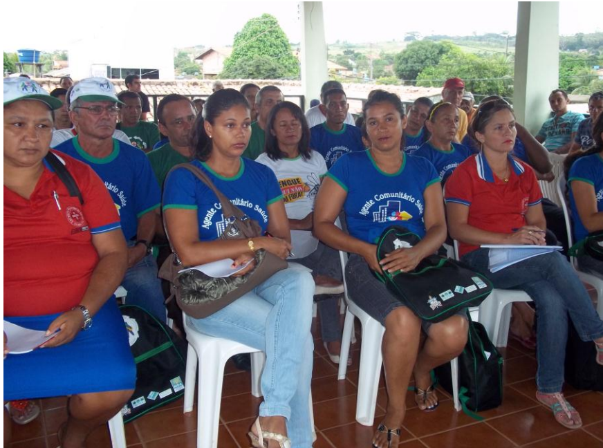
Figura 03. Atividades Palestras em Sala de Aula

O 2º Tempo Escola iniciou em 13 de julho e estendendo-se até 27 de julho de 2006, tendo se realizado na Casa Familiar Rural do Município de Pacajá. Eixo Temático: Educação, Saúde e Cidadania na Transamazônica e Tema Integrador: Trabalho, política e saúde no campo... a realidade da Amazônia.