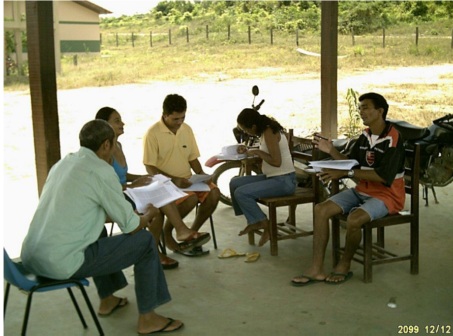
Figura 02. Atividades de trabalho em grupo