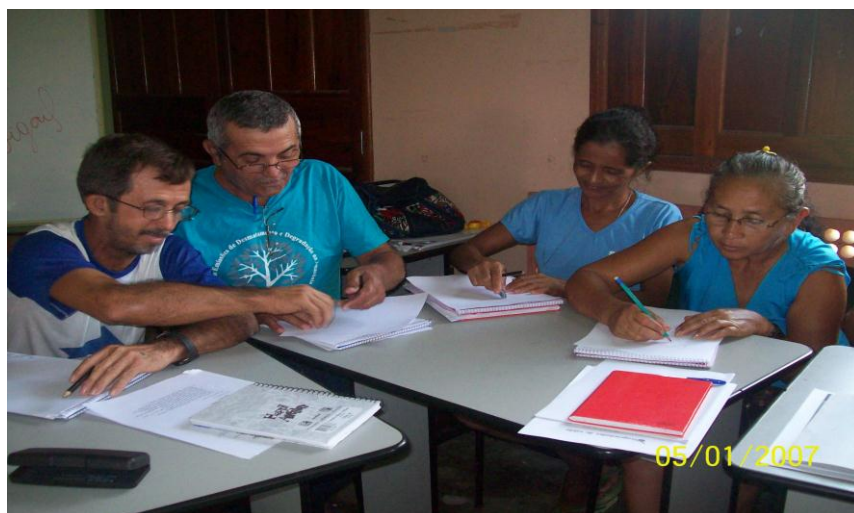
Figura 06. Atividades de trabalho em grupo

No encerramento foi feita uma confraternização com toda turma de educandos, técnicos, professores, bolsistas, coordenadores e convidados, juntamente com uma avaliação oral e apresentação dos trabalhos de artes o que foi extremamente produtivo, com produção de poesias, musica e danças.