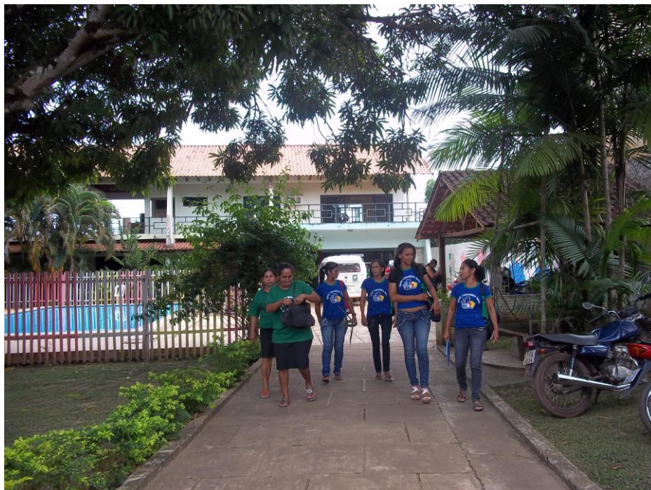
Figura 10. Alunas do curso em atividade de estágio no CAPES/Altamira.

Cada educando teve que cumprir 75 horas de estágio supervisionado, realizando-o junto a secretarias municipais de assistência e a comunidade.