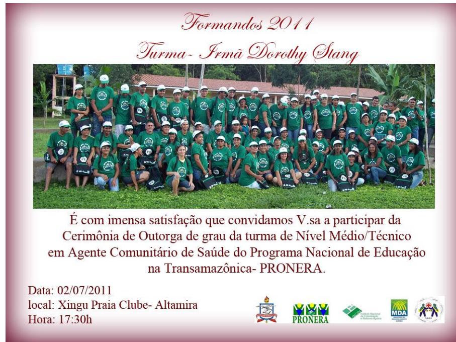
Figura 12: Convite para Cerimônia de Outorga.