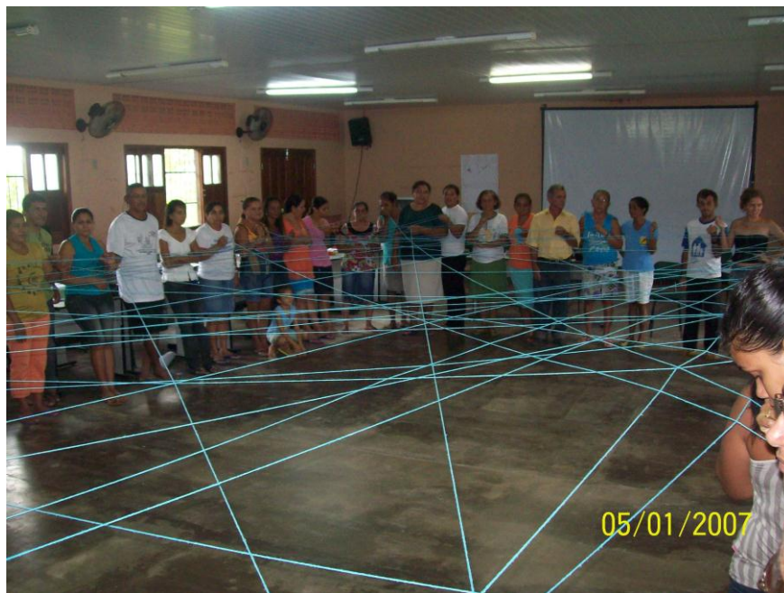
Figura 04. Dinâmicas de conhecimento/socialização

No segundo semestre de 2007 realizou-se apenas 01 alternância Tempo Escola, porém com mais disciplinas e maior aproveitamento do tempo, buscando representar a 5ª. e a 6ª. Alternâncias, uma vez que os recursos destinados ao Projeto, para o exercício de 2007 não foram liberados. Desta forma, durante o exercício de 2007 aconteceu duas alternância /Tempo Escola, uma no primeiro semestre e outra no segundo semestre, esta última correspondendo a 02 (duas) Alternâncias, ou seja, o 5ª. e 6ª. Tempo Escola que se realizou no período de 02 a 20/12/07, esta alternância aconteceu na Casa Familiar Rural de Brasil Novo, cada turma cursou quatro componentes curriculares, perpassadas pelo tema gerador Saúde e Ambiente na Transamazônica e como tema integrador: Meio Ambiente na Amazônia: A Importância do ACS ao meio ambiente amazônico, ambos articulados na teia do conhecimento do Projeto/Curso.